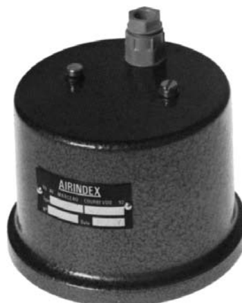
Avec capot de protection Sortie électrique par PE 7