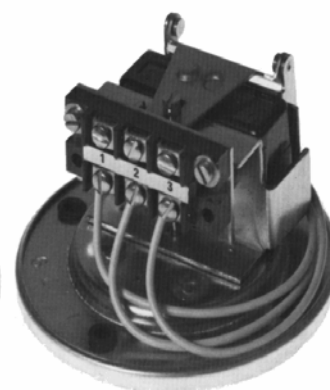
Non capoté, pour être incorporé dans ensembles