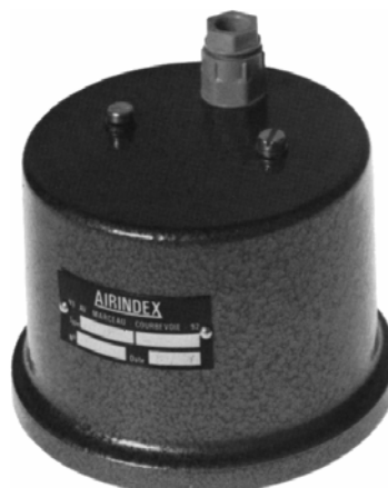
Avec capot de protection Sortie électrique par PE 7